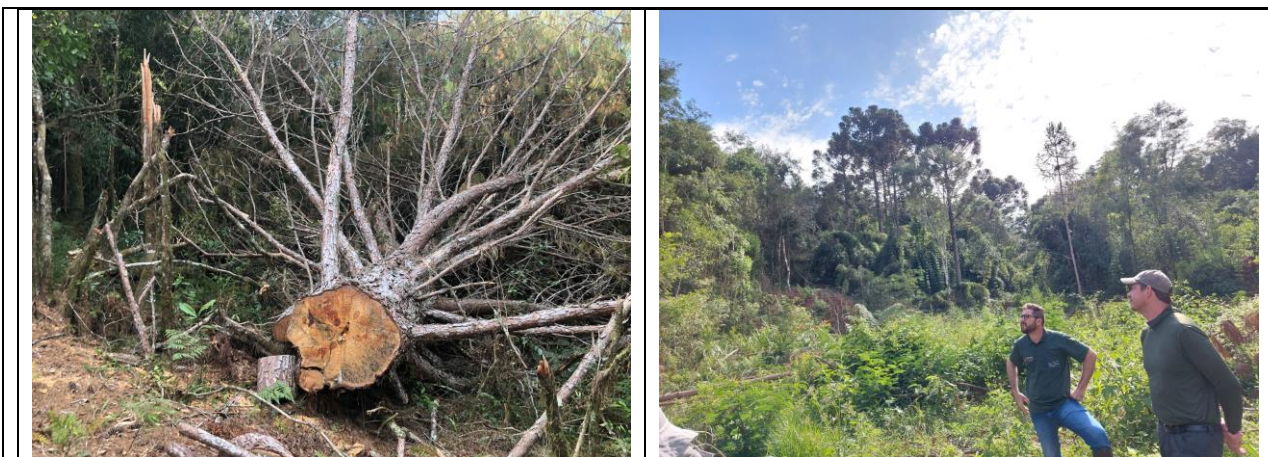
Figura 03 – Atividade de Controle do Pinus no PAERC