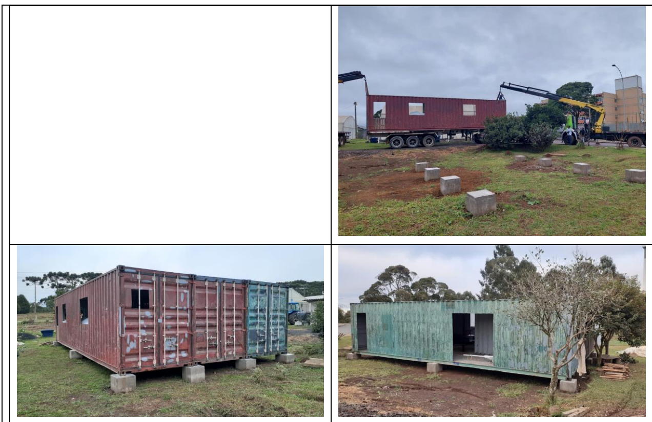
Figura 07 – Início do processo de implementação do Centro Reforma no Campus da UFSC de Curitibanos.