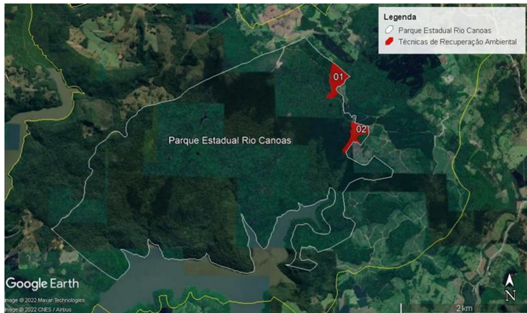
Figura 2. Zonas de uso das áreas do PAERC, com destaque para as Zonas de Recuperação e duas glebas onde foram realizados os trabalhos de controle de Pinus.

A área foco dos trabalhos de controle são as Zonas de Recuperação, na porção norte do PAERC, áreas previstas no Projeto reforma como prioritárias das ações. No período de Dezembro de 2022 a Fevereiro de 2023 foram realizados mais 20 hectares de controle de Pinus no PAERC, divididas em 2 Glebas, totalizando até agora 60 hectares (40 + 20 hectares).