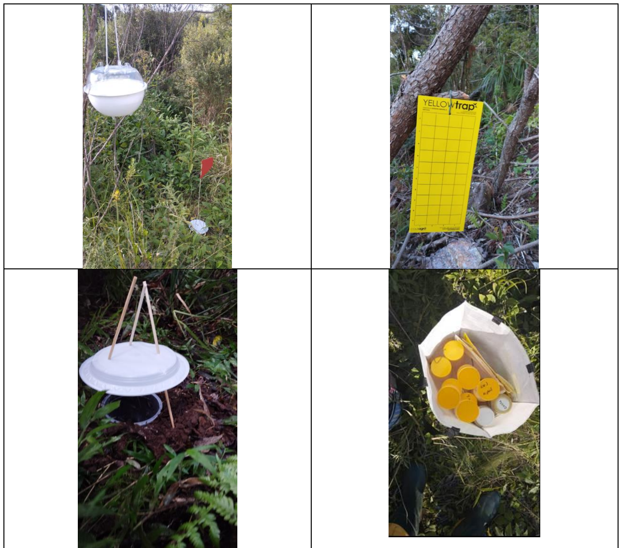
Figura 01 –Monitoramento na Área restaurada no PAERC

Dentro dessa ação, foi realizado em abril de 2023 a instalação de diversas armadilhas para coleta de grupos funcionais de entomofauna associada ao processo de regeneração da área (FIGURA 01). As armadilhas foram instaladas na área 20 hectares restauradas do PAERC em dezembro/janeiro (Ordem de Serviço Nº: 023089), área experimental e área controle (Mata sem invasão). O Monitoramento será realizado nas 4 estações, totalizando 1 ano de avaliação inicial.